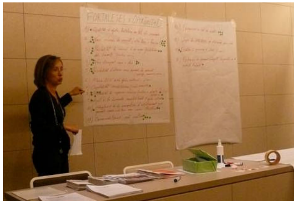
Comissions de Treball Abril i maig 2009

Realment, les Comissions han representat un espai privilegiat per a l'intercanvi de punts de vista i diagnosi ; les valoracions sorgides de les Comissions conformen una aportació significativa al Diagnòstic. El valor i les aportacions del conjunt de les Comissions de treball és de gran rellevància del Pla, tant pel que fa als seus objectius de procés com de contingut.