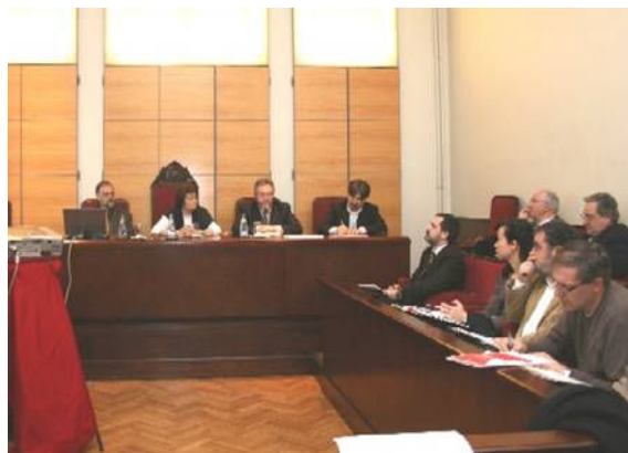
Consell Econòmic i Social de Barcelona 13 març 2009