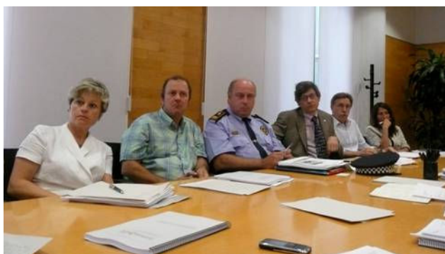
Constitució Taula Tècnica Municipal Turisme i Ciutat 14 juliol 2009

Gerència Municipal Promoció Econòmica Medi Ambient Prevenió, Mobilitat i Seguretat Serveis Generals i Coordinació Territorial Urbanisme i Infraestructures Educació, Cultura i Benestar Districte Ciutat Vella