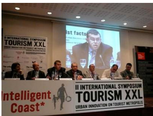
II Simposium Tourism XXL www.intelligentcoast.es 28 maig 2009

Entre les diverses presentacions que es detallen en l'annex d'aquest document, poden destacar les realitzades a la Comissió Permanent del Consell de Ciutat, Comissió de Turisme de la Federació de Municipis, Consell de Gremis de Comerç, Serveis i Turisme, Consell Econòmic i Social de Barcelona, Gremi d'Hotels de Barcelona, II Simposi Internacional Turisme XXL, i Convenció de Turisme de Barcelona, entre moltes altres.