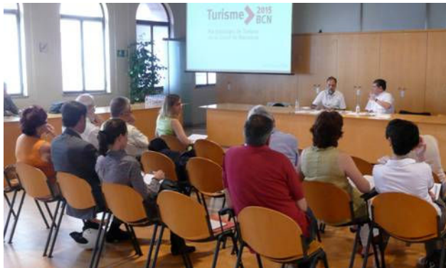
GTT Pacte per la Mobilitat 22 juliol 2009