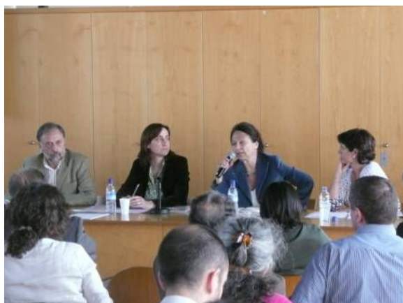
Comissió Turisme a Ciutat Vella 12 maig 2009

El Pla ha posat en funcionament la Comissió Turisme a Ciutat Vella, que a causa de la significativa importància del turisme en aquest Districte, tindrà durada al llarg de tot el Pla, i probablement més enllà . Aquesta Comissió es convoca conjuntament amb el Districte de Ciutat Vella.