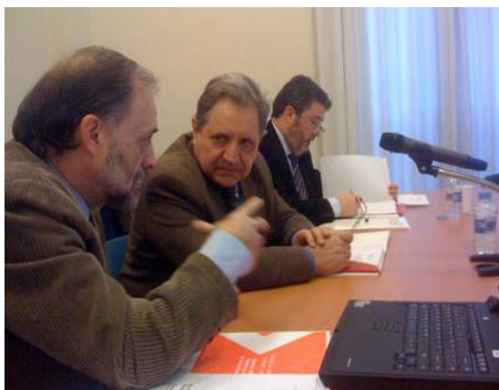
Presentació Consell de Gremis 5 febrer 2009

En matèria de comunicació, el Pla ha realitzat diverses presentacions a institucions, seminaris, jornades i convencions, en les que s'ha exposat els objectius, mètodes de treball i principals accions realitzades.