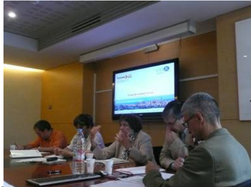
GTT Professionalitat. CESB 11 juny 2009