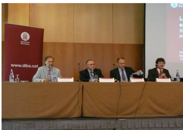
Segona Trobada de Regidors. Diputació de Barcelona 13 maig 2009

Una de les accions més remarcables ha estat la celebració d'una sessió de treball amb responsables municipals de la província de Barcelona per tractar els principals continguts de les Comissions de treball del Pla Estratègic "Barcelona, capital de Catalunya" i "Entorn metropolità", l'1 de juliol de 2009 al Centre d'Estudis i Recursos Culturals de Barcelona, així com la presentació del Pla Estratègic en el si de la Trobada de responsables polítics i tècnics de la província organitzada per la Delegació de Turisme.