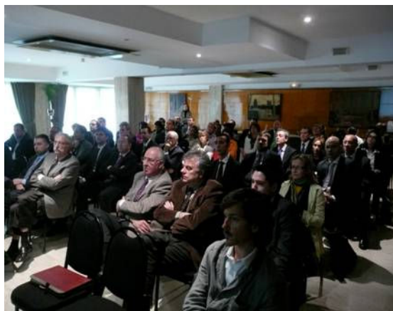
Gremi d'Hotels de Barcelona www.barcelonahotels.es 17 abril 2009

Entre les diverses presentacions que es detallen en l'annex d'aquest document, poden destacar les realitzades a la Comissió Permanent del Consell de Ciutat, Comissió de Turisme de la Federació de Municipis, Consell de Gremis de Comerç, Serveis i Turisme, Consell Econòmic i Social de Barcelona, Gremi d'Hotels de Barcelona, II Simposi Internacional Turisme XXL, i Convenció de Turisme de Barcelona, entre moltes altres.