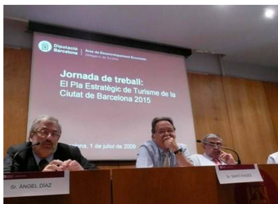
Jornada de Treball. Diputació de Barcelona 1 juliol 2009