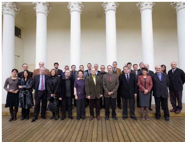
Sessió de treball presidents i relators de Comissions 3 març 2009

La realització de les Comissions de treball, que ha tingut lloc durant els mesos d'abril i maig de 2009, ha concentrat una part molt important dels esforços del Pla Estratègic en la seva fase d'anàlisi.