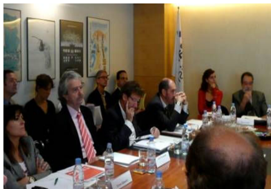
Sessions Focus Grup Octubre 2008

La realització dels Focus, a més de complir amb l'objectiu primordial de desvetllament dels principals temes crítics i aspectes clau del turisme a Barcelona, va donar a conèixer el Pla i va permetre compartir els seus objectius a un ampli col·lectiu de persones. S'obria, així, una primera reflexió oberta i compartida del turisme a Barcelona.