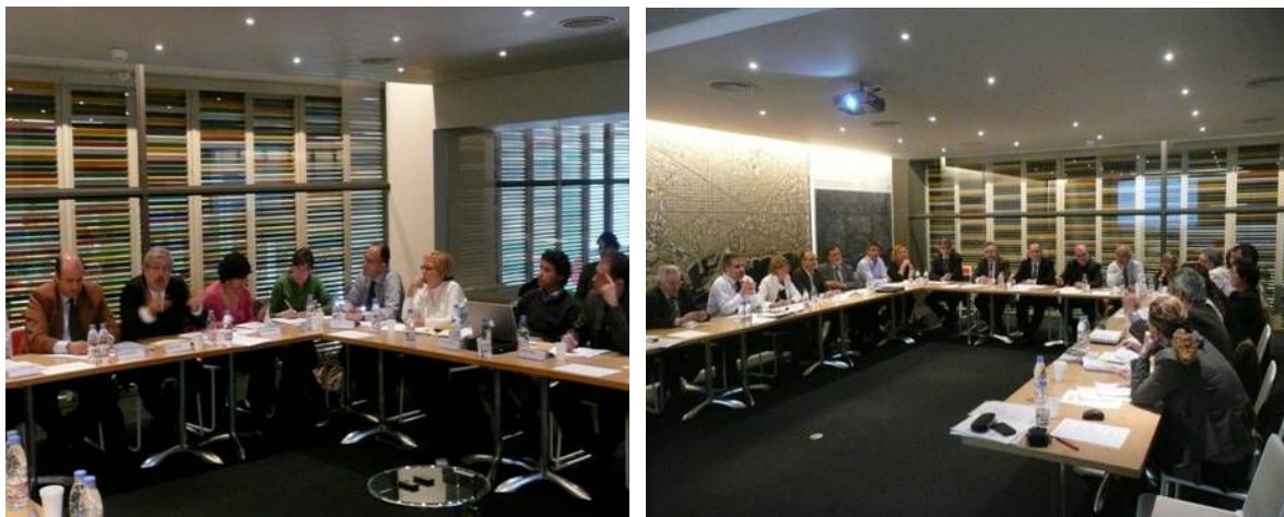
Comissions de treball Abril i maig 2009

> Comissió Allotjament: El sector de l'allotjament (ja siguin hotels, apartaments o d'altres fórmules d'allotjament) defineix part important de l'oferta d'acollida de Barcelona com a destinació turística, i essent un d'aquells sectors nascuts i enfortits com a conseqüència directa del fet turístic, és receptor directe de les rendes generades pel mateix i, a la vegada, peça fonamental per al desenvolupament i èxit del turisme a la ciutat. L'objectiu de la comissió es posar al voltant d'una mateixa taula les diferents tipologies d'allotjament, veure les relacions entre d'elles i, allò més important, la relació entre les altres peces i agents territorials i socials de la ciutat.