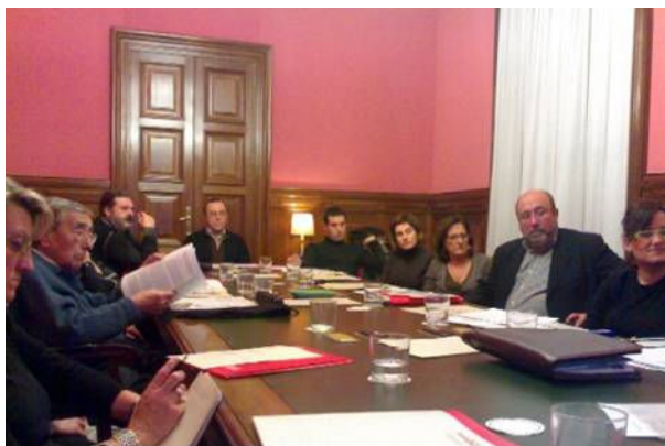
Consell de Ciutat. Comissió permanent 15 desembre 2008

Més enllà de comptar amb la referència i experiència d'altres plans estratègics significatius pel turisme a Barcelona, el Pla també s'integra en les dinàmiques i processos d'institucions i organismes de la ciutat de Barcelona que contempnen el turisme o la ciutat en general com un dels seus temes d'interès. Així, el Consell de Ciutat www.conselldeciutat.cat o el Consell Econòmic i Social de Barcelona www.bcn.es/cesb incideixen en la reflexió i tasca del Pla Estratègic, de la mateixa manera que aquestes institucions incorporen les línies de pensament i estratègia del Pla.