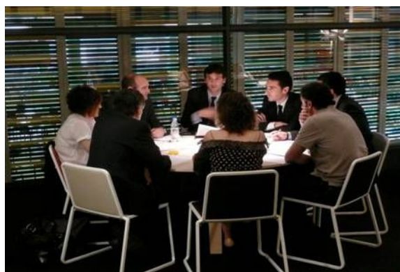
Comissions de treball Abril i maig 2009

En el seu conjunt, les Comissions de treball han activat una alta i diversa participació de persones vinculades a la ciutat i al turisme de Barcelona i del país, raó per la qual s'ha obtingut una valuosa quantitat d'informacions i d'opinions que alimenten la diagnosi del turisme a Barcelona. Més de 250 persones de Barcelona i de Catalunya han participat en les 20 sessions de treball.