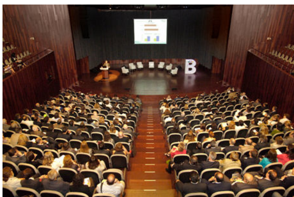
II Convenció de Turisme de Barcelona 5 juny 2009

El Pla compte també amb la pàgina web www.turismebcn2015.cat en la que s'hi poden trobar diverses informacions relatives al Pla i al turisme a Barcelona: el web es divideix en els següents apartats: Què és el Pla? , traduït a l'anglès i el castellà, en què es detallen els objectius, la metodologia i l'organització del Pla; Actualitat , en el qual es publiquen totes aquelles notícies que fan referència al Pla; Documentació , espai on es posa a disposició del públic tots aquells