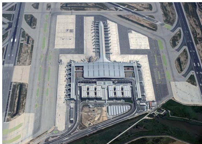
Nova terminal 1 de l'aeroport