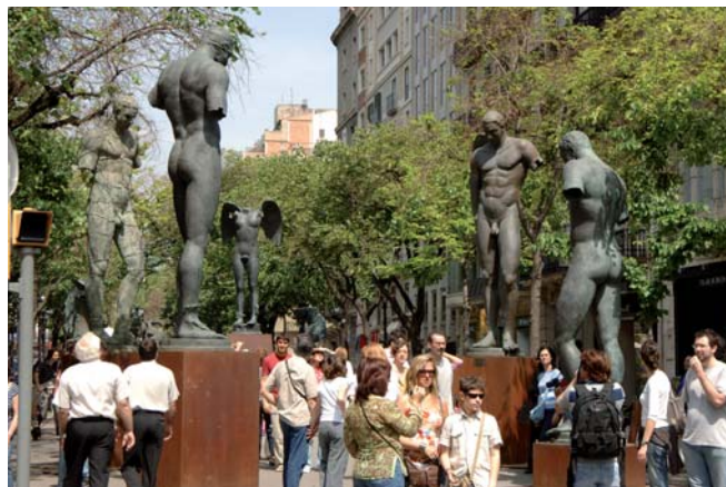
Rambla de Catalunya

Nota 4: Dades de la ciutat de Roma revisades respecte anys anteriors. Datos de la ciudad de Roma revisados respecto años anteriores. Data of the city of Rome revised with respect to previous years.