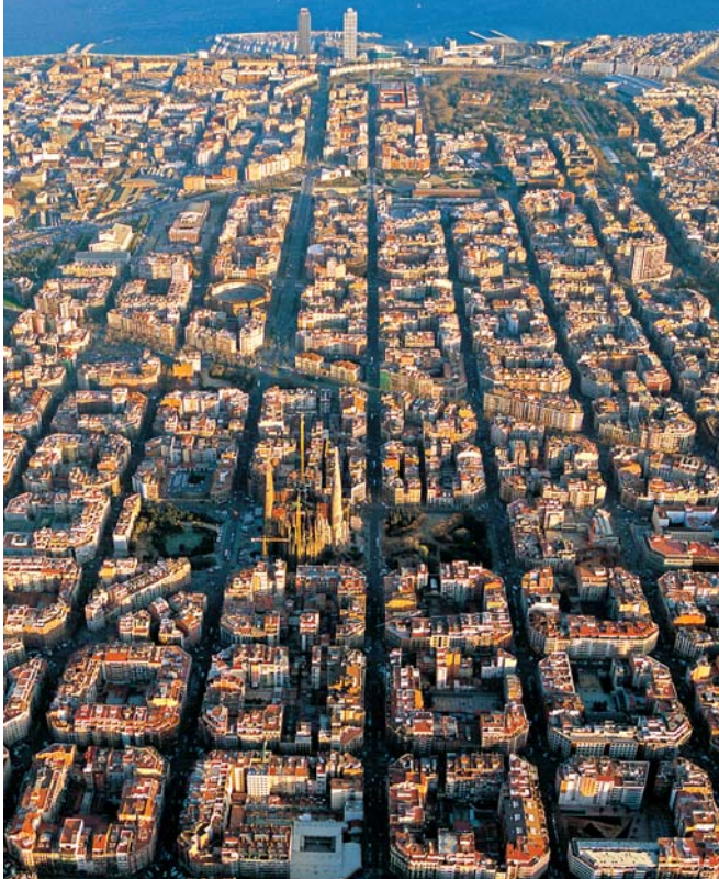
Panoràmica de l'Eixample